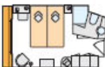
C 2-Bett-Außenkabine, C, französischer Balkon, 14,5 m 2 Deck 2

Die Fenster können nur in der Kategorie 2-Bett-Außenkabine C und D mit französischem Balkon geöffnet werden.