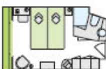
D 2-Bett-Außenkabine, D, französischer Balkon, 14,5 m 2 Deck 3