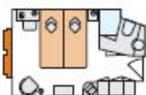
A 2-Bett-Außenkabine, A, 14,5 m 2 Deck 1

WERFT: Neptun Werft GmbH, Warnemünde PASSAGIERE: max. 174 Gäste KABINEN: 86 Außenkabinen je Schiff LÄNGE: 125,8 m BREITE: 11,4 m GESCHWINDIGKEIT: max. 24 km/h ANTRIEB: zweimal 800 kW/ insgesamt 2.174 PS BAUJAHR: 2005 A-ROSA LUNA, A-ROSA STELLA FLAGGE: Deutschland