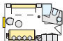
S 2-Bett-Außenkabine, S, mit Zusatzbett, 14,5 m 2 Deck 1